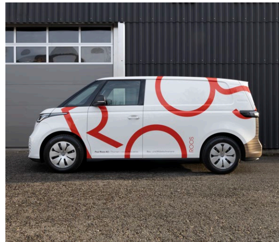
Paul Roos AG Branding. Web.