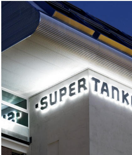
SUPERTANKER, Zürich Signaletik.