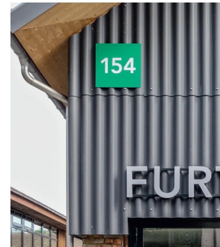
Areal Furter, Dottikon Signaletik.