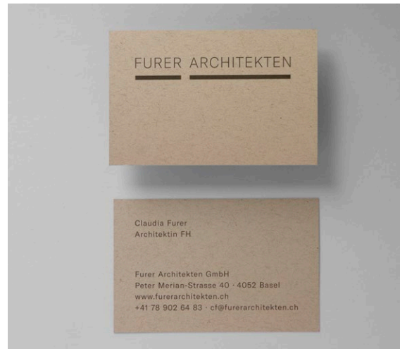
Furer Architekten Branding.