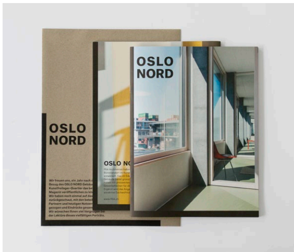
OSLO NORD Magazin Editorial Design.