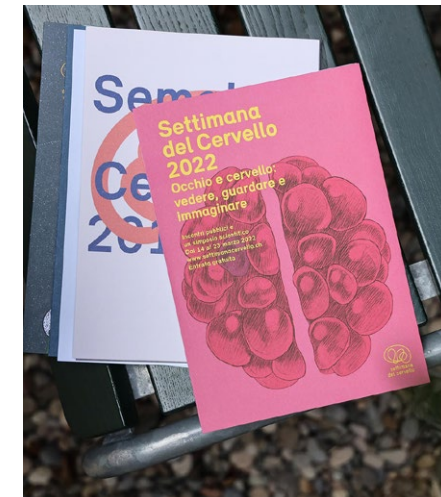
Woche des Gehirns Editorial Design.